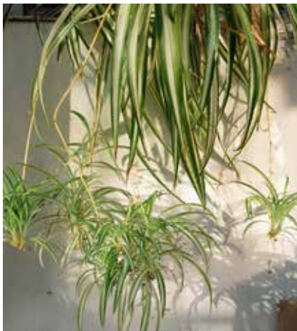
Grünlilie mit Kindel an Blütenprossen

Kindel aus, z.B. Erdbeere und Grünlilie. Kindel sind kleine Pflänzchen, die noch durch die Wurzeln der Mutter versorgt werden. Wenn sie mit einer geeigneten Erde in Berührung kommen, wurzeln sie dort und lösen die Verbindung zur Mutter.