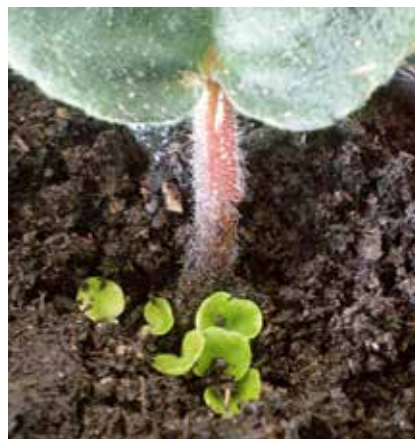
Usambaraveilchen: Blattsteckling mit frischen Austrieben

die neuen Pflanzen weniger anfällig für Schädlinge und Krankheiten. So gedeihen sie zu prächtigen Exemplaren. Eine Pflanze wächst zwar von alleine, aber besonders Zier- und Nutzpflanzen brauchen weiterhin Pflege – wer eigene Pflanzen hat, kennt das. In den meisten Haushalten stehen Zimmerpflanzen, Nutzgärten erfreuen sich neuer Belieb-